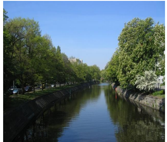
Typisches Erscheinungsbild des Landwehrkanals

Am 19. November 2007 konstituierte sich das Mediationsforum als zentrales Gremium des Verfahrens. Als Ziel wurde in dem gemeinsam formulierten Arbeitsbündnis vom 21. Januar 2008 festgehalten, eine „(...) von allen Beteiligten als nachhaltig, d.h. als ökonomisch, ökologisch und sozialverträglich angesehene, unter Berücksichtigung des Denkmalschutzes stehende Lösung für die vielfältigen Themen sowohl für die gegenwärtige Situation als auch für die Zukunft des Landwehrkanals in Berlin in einem Konsensfindungsverfahren zu erarbeiten.“ Beschlüsse können nur im Mediationsforum und nur einvernehmlich getroffen werden. Alle anderen Gremien dienen auch der Vorbereitung von gemeinsamen Beschlüssen.