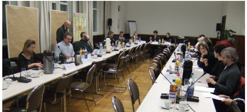
Blick ins Mediationsforum

Aufgrund der Ereignisse im Vorfeld der Mediation ging es zunächst darum, wieder eine vertrauensvolle Zusammenarbeit aller Beteiligten aufzubauen. Konkret standen die Verbesserung der Kommunikation untereinander, der Informationswege und des Umgangs miteinander sowie die Verlässlichkeit über Abläufe, Vorgehensweisen, Absprachen etc. im Zentrum der mediativen Arbeit.