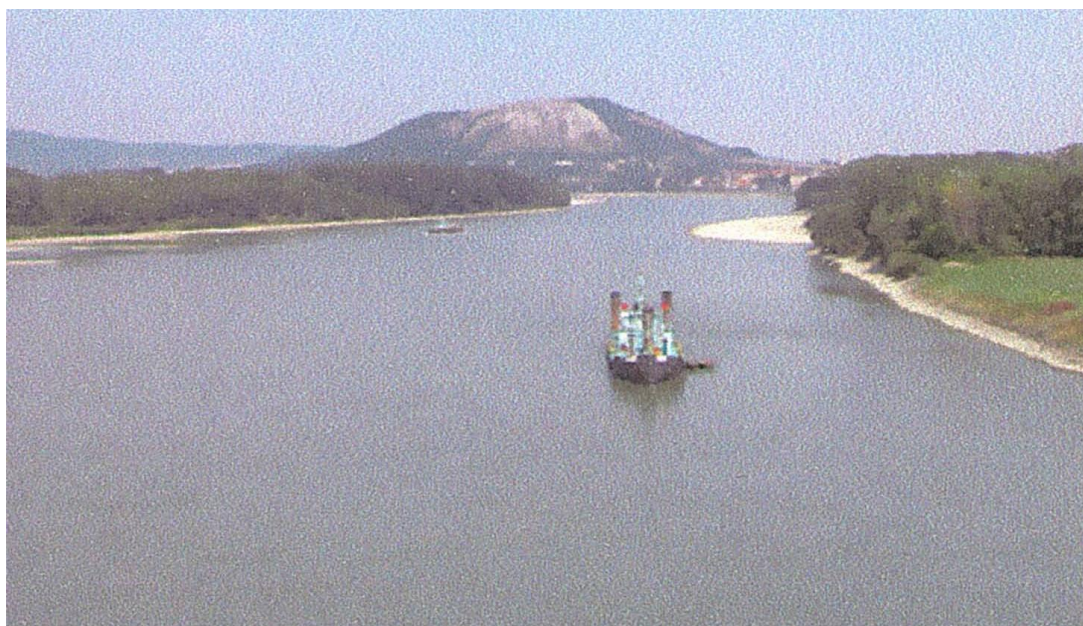
Die Donau als Wasserstraße im Flussabschnitt zwischen Wien und Bratislava

Mit dem „ Flussbaulichen Gesamtprojekt für die Donau östlich von Wien “ soll die Stromsohle der Donau stromabwärts der Staustufe Wien bis zur österreichisch-slowakischen Staatsgrenze stabilisiert werden. Einerseits wird dabei der Nationalpark Donau-Auen vom Uferrückbau und von der Gewässervernetzung profitieren, andererseits soll die Schifffahrt eine tiefere, leistungsfähigere Fahrwasserrinne erhalten. An der Frage, wie tief diese Rinne sein darf und wie die Projektmaßnahmen konkret aussehen sollen, entzündeten sich heftige Diskussionen zwischen Schifffahrt, Ökologie und Wasserbau. Das Österreichische Bundesministerium für Verkehr, Innovation und Technologie rief deshalb ein Moderationsforum ins Leben, welches den von den Projektmaßnahmen betroffenen Institutionen und Personen eine Plattform für ausführliche Information und einen gemeinsamen Dialog bot. Dieses Forum begleitete ein Gremium von Fachleuten (Leitungsausschuss) bei der Erstellung der Grundlagen für die Umweltverträglichkeitserklärung des „ Flussbaulichen Gesamtprojekts für die Donau östlich von Wien “.