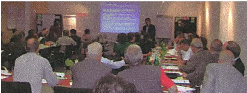
Blick ins Moderationsforum

Durch die frühzeitige Einbindung aller Beteiligten und mit Hilfe eines effizienten und kostensparenden Informations- und Abstimmungsverfahrens mit Lösungskompetenz gelang die Sicherung einer der wichtigsten europäischen und nationalen verkehrspolitischen Maßnahmen, der Sohlstabilisierung der Donau zwischen Wien und der österreichisch-slowakischen Staatsgrenze als Rahmenbedingung für die Nutzung der Donau als leistungsfähigen Verkehrsweg.